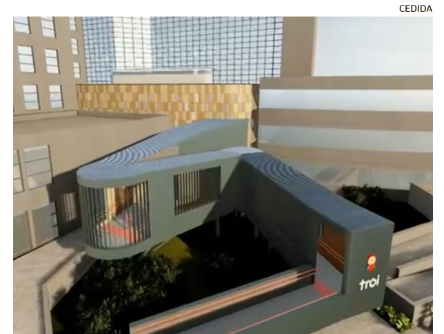
EL CENTRO ONCOLÓGICO INFANTIL “TROI” DE TEMUCO.

El nuevo centro oncológico infantil “Troi” involucrará una inversión de 2 mil 500 millones de pesos y se financiará con recursos de la misma Fundación