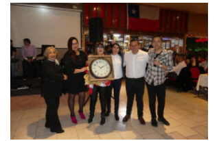
49 AÑOS FESTEJA EL SINDICATO.

“En la ceremonia de la AEF, en Santiago, comenté el aporte